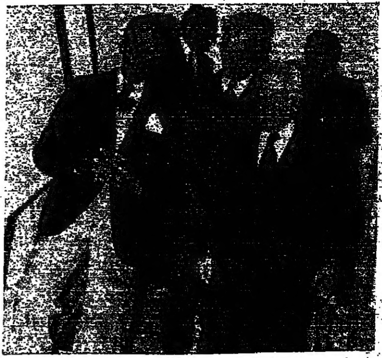
الرئيس فرنجي والشيخ بيار الجميل وبعض الاعضاء بعد انتهاء الجلسة الصباحية